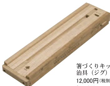
箸づくりキット用 治具(ジグ) 12,000円(税別) ●サイズ/約9.8×33.8×高3.8cm