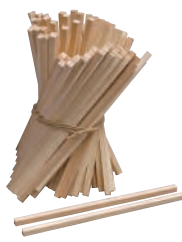
箸づくり用木地 ひのき 4,300円(税別) ●サイズ/長さ約24cm