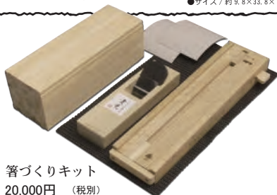
箸づくりキット 20,000円(税別)