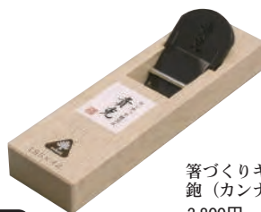
箸づくりキット用 鉋(カンナ) 3,800円(税別) ●サイズ/約5.5×19.5×高4.5cm